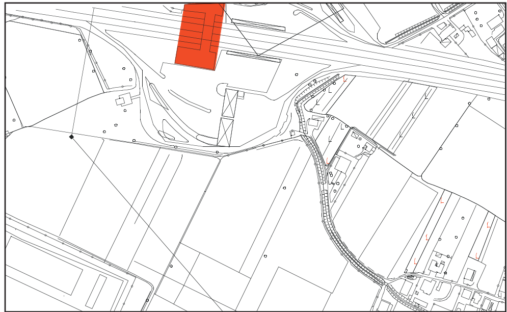
foto stato attuale